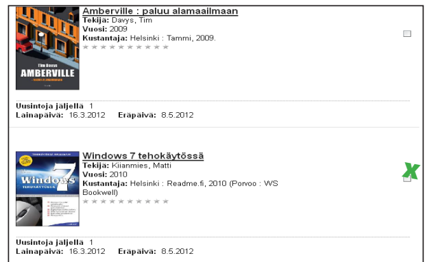
Kuva 4: Lainojen uusinta