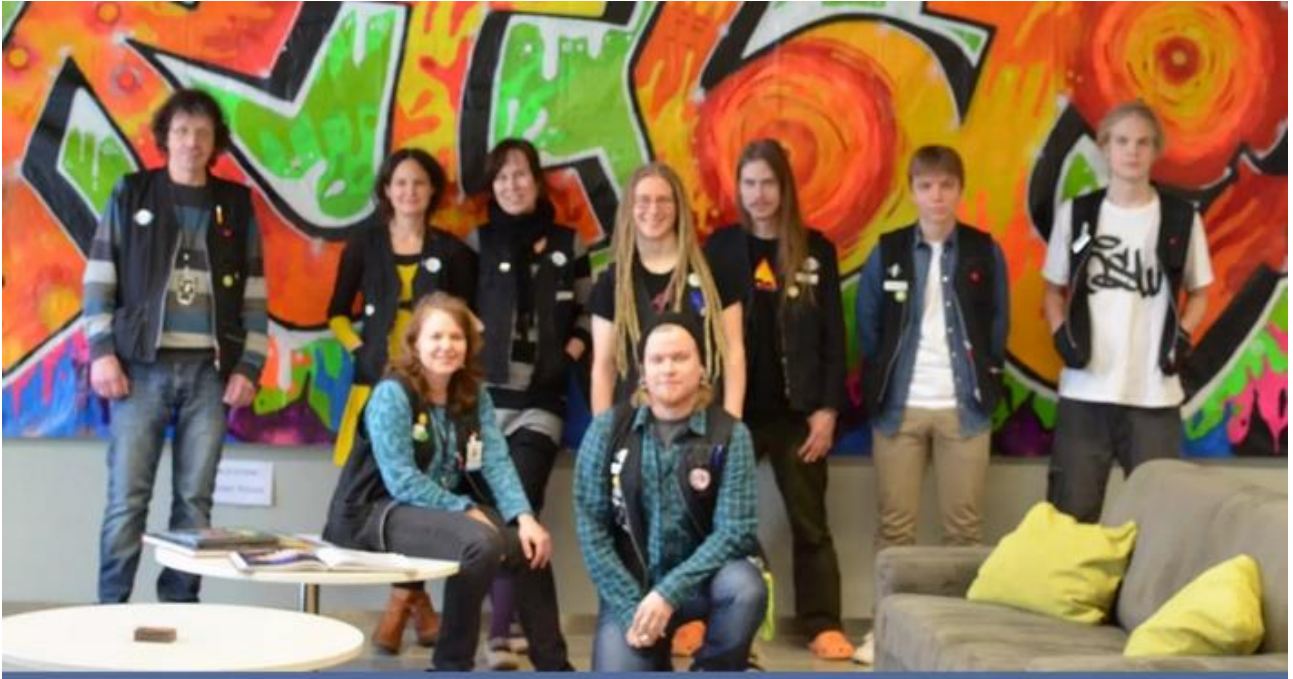
Espeen tiimiä liiveissään