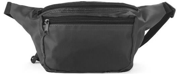
Esimerkit olkalaukusta ja vyölaukusta