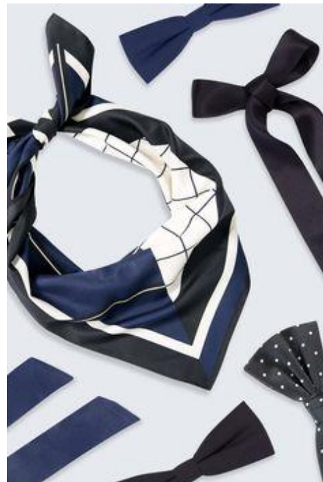
Metson oma tuubihuivi ja esimerkki bandana-tyylisestä huivista